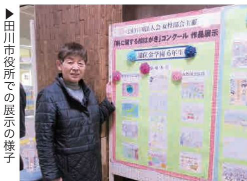
▶田川市役所での展示の様子