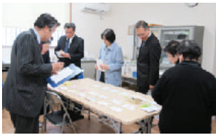
絵はがき審査の様子