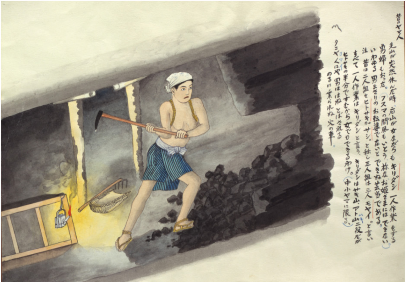
筑豊炭坑絵巻 山本作兵衛