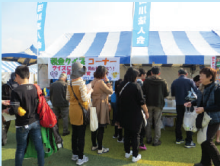
昨年のTAGAWAコールマインフェスティバルの様子

青年部会・女性部会では、税に対して関心を深めて頂くよう、「税を考える週間」行事の一環として税金クイズを実施し、毎年、多くの地域住民の方にクイズに挑戦して頂いています。今年度も、管内のイベントや道の駅での実施を予定しておりますので、ぜひご参加ください。景品も用意しております。