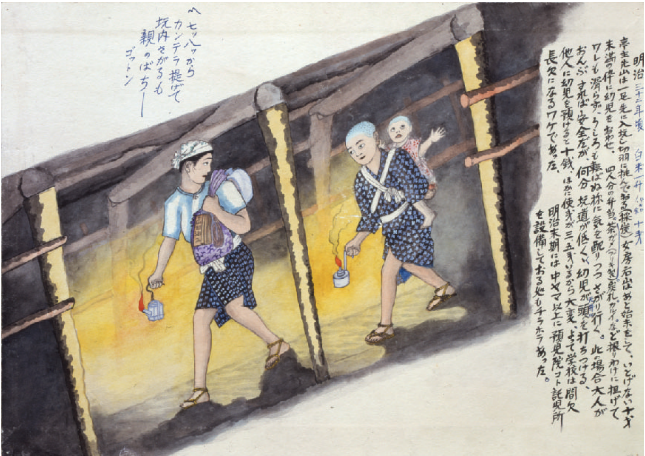
筑豊炭坑絵巻 山本作兵衛