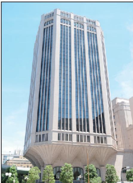
大同生命大阪本社ビル(大阪市西区江戸堀) ～加島屋が店を構えた地に建つ～

《引受保険会社》アフラック北九州支社 〒802-0005 北九州市小倉北区堺町1-2-16 十八銀行第一生命共同ビル8階 TEL 0120-5555-95