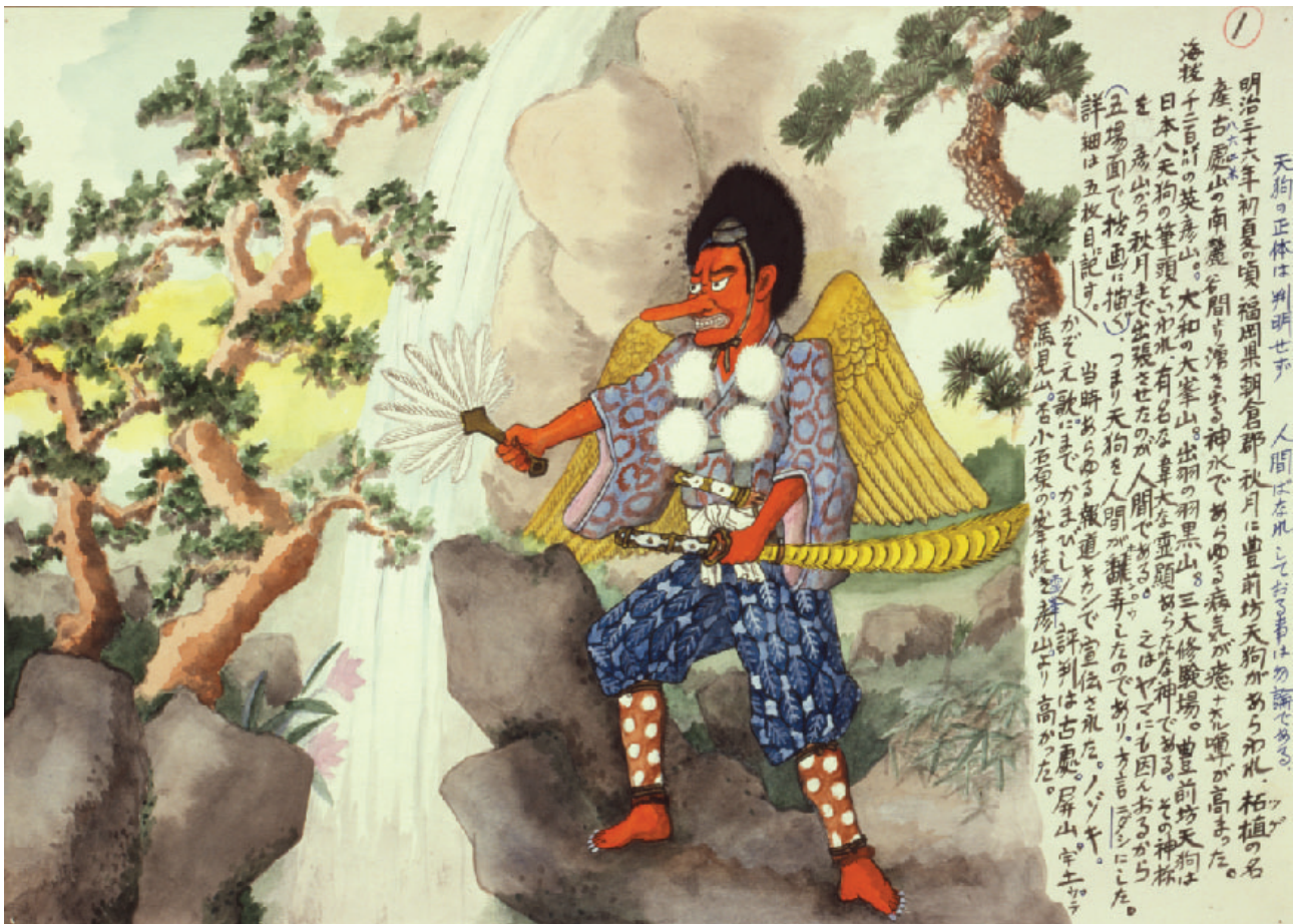
筑豊炭坑絵巻 山本作兵衛