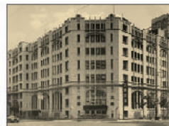
旧肥後橋本社ビル (設計：W・M・ヴォーリス)