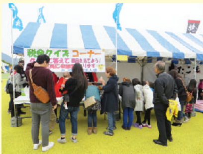
昨年のTAGAWAコールマインフェスティバルの様子

青年部会・女性部会では、税に対して関心を深めて頂くとう、「税を考える週間」行事の一環として税金クイズを実施し、毎年、多くの地域住民の方にクイズに挑戦して頂いています。今年度も、管内のイベントや道の駅での実施を予定しておりますので、ぜひご参加ください。景品も用意しております。