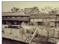
大同生命の礎を築いた 大坂の豪商“加島屋”