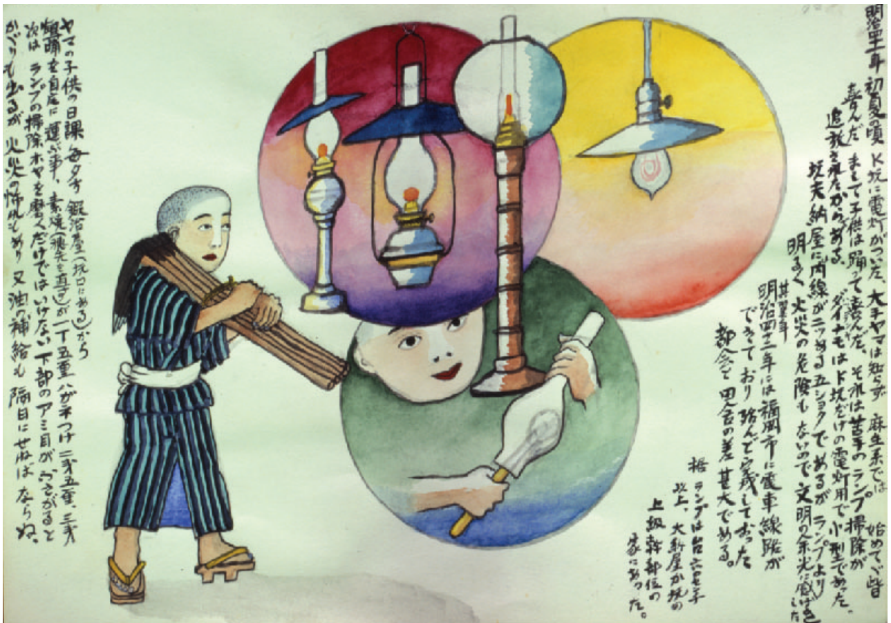
筑豊炭坑絵巻 山本作兵衛