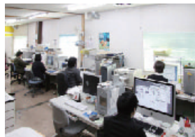
デザイン・製版室