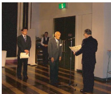
マルボシ酢 株式会社