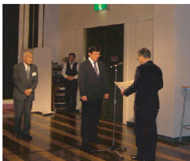
株式会社 川 食

そのため、1月3月迄を大型保障制度推進の最終キャンペーンとして、厚生委員会あげて強力に推進して参りたいと考えておりますので、知り合いの方々へ声をかけて頂きますよう、ご協力をお願い致します。