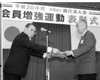
加入率の伸びの高い支部 第13支部