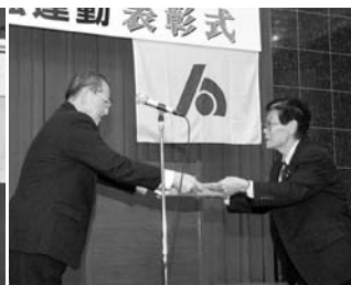
加入率の高い支部 第1支部