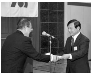
加入率の伸びの高い支部 第9支部

特別賞として、支部長に副賞が授与されました。 今年の会員増強運動は、10月1日～31日の間、全16支部での支部・地区会議を開催し、役員をはじめ、支部長、地区長、青年、女性部会役員による加入勸奨運動を昼夜を問わず強力に実施しました。その結果、加入率は87.3%と低下しましたが、加入企業数は昨年より26社増えて、77社の企業の方々が加入して頂きました。