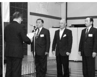
加入率の高い支部 第8支部