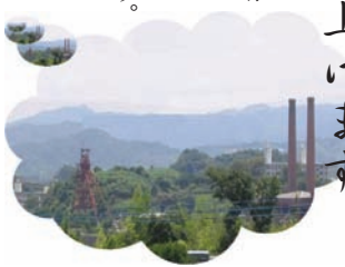
署から見える二本煙突と伊田坑