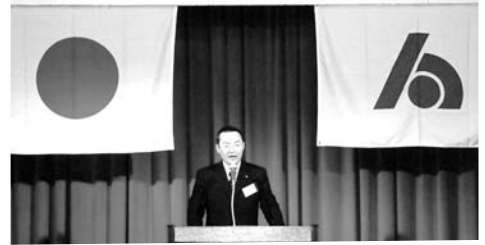
平成20年度 第19回(社)田川法人会青年部会 定時総会